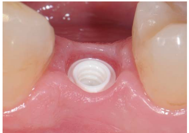
Entzündungsfreies Weichgewebe um Keramikimplantat.

Somit kann heute bereits festgehalten werden: Moderne Keramikimplantate stellen in der richtigen Indikationsstellung und im richtigen Umgang eine Ergänzung des Behandlungsspektrums in der zahnärztlichen Implantologie dar und werden auch künftig zunehmend an Bedeutung gewinnen. Eine Übersicht aktueller Keramikimplantate finden Sie auf den folgenden Seiten. ■